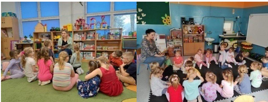
„Cała Polska Czyta Dzieciom” (2025)

PBS i filie realizowały całoroczną kampanię „Cała Polska Czyta Dzieciom” (817 osób), a także m.in.: Pasowanie na Czytelnika (22 osób), Bajki o Emocjach – wizyta w Przedszkolu w Krasnosielcu (100 osób), Dzień Kobiet – warsztaty plastyczne w Amelinie i Rakach (41 osób), Międzynarodowy Dzień Książki dla Dzieci (105 osób), Wielkanoc – głośne czytanie (29 osób), PlantCrossing (15 osób), Akcja Żonkile z harcerzami (30 osób), Dzień Dziecka (13 osób), Dni Krasnosielca – malowanie toreb (70 osób), Wakacje z Biblioteką – filia Drażdżewo (101 osób), Dzień Kropki – filia Raki (25 osób), Ogólnopolski Dzień Głośnego Czytania (146 osób), Dzień Postaci z Bajek – filia Raki (45 osób), Święto Niepodległości – teatryk Kamishibai (43 osób), Światowy Dzień Pluszowego Misia – filia Raki (50 osób), Warsztaty Bożonarodzeniowe (116 osób), Wizyta w Domu Seniora Zawady Dworskie (40 osób).