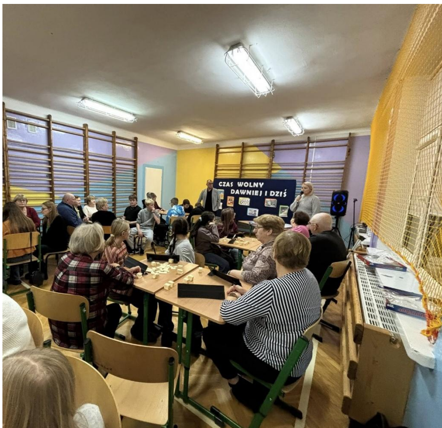
Spotkanie integracyjne z uczniami SP w Rakach (2025)