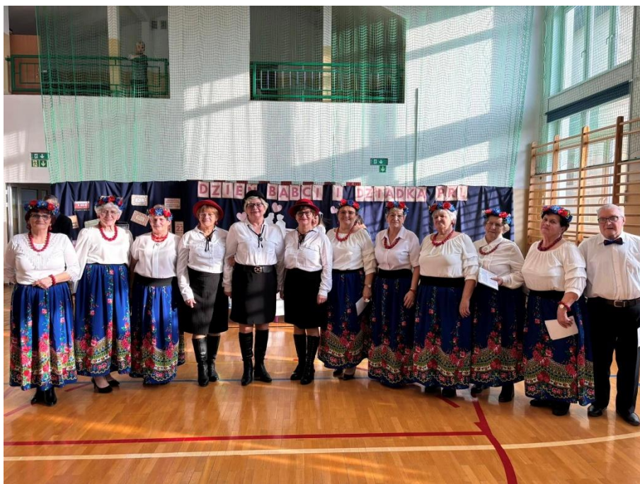
Występ z okazji Dnia Babci i Dziadka w SP w Drążdzewie (2025)