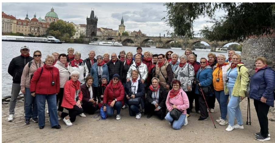
Wycieczka Karpacz - Praga - Skalne Miasto (2025)