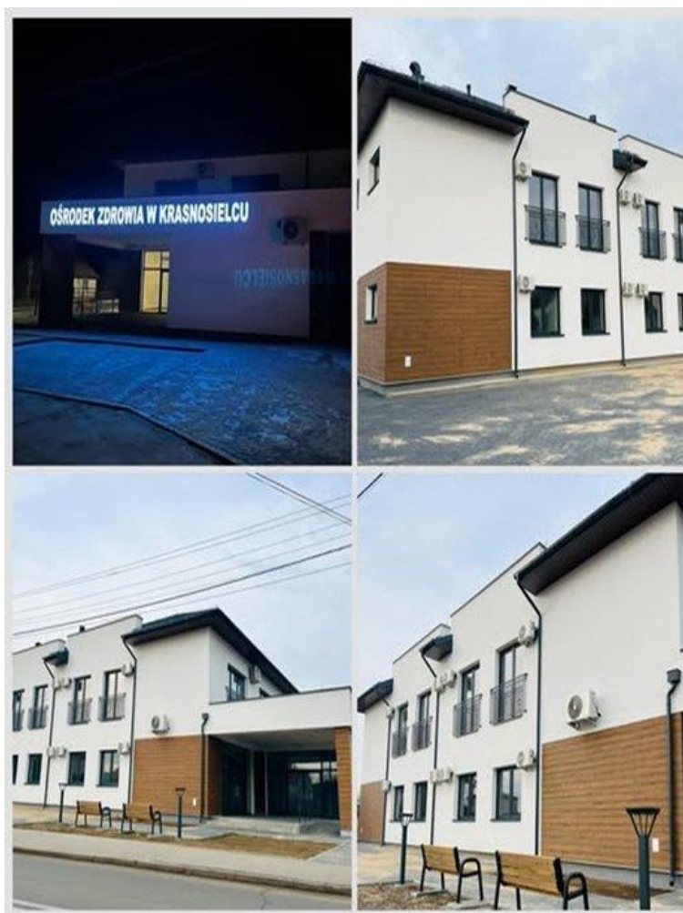
Nowy Ośrodek Zdrowia w Krasnosielcu (2025)