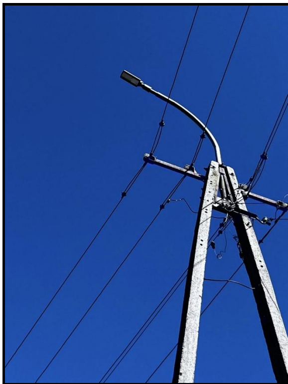
Modernizacja oświetlenia (lampy energooszczędne) (2025)

Dzięki dotacji WFOŚiGW w Warszawie w wysokości 75 600 zł zmodernizowano oświetlenie w miejscowościach: Ruzieck, Niesułowo-Wieś, Pieczyska, Sulicha, Krasnosielc (ul. Ogrodowa, Cmentarna, Młynarska, Przejściowa, Polna, Przechodnia). Całkowity koszt zadania wyniósł 94 500,00 zł.