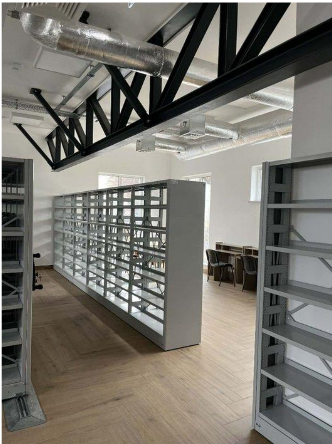
Przebudowa budynku GOK wraz z dobudową nowej siedziby PBS (2025)