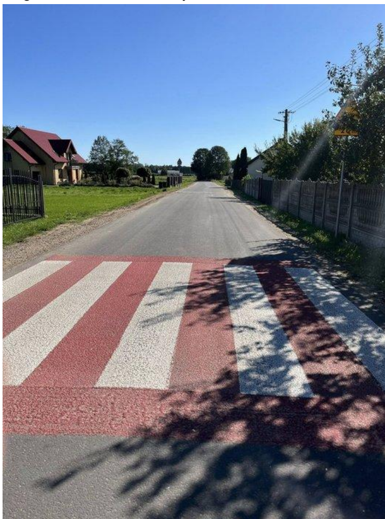
Przebudowa drogi w Woli Pienickiej (2025)

Przebudowa dróg gminnych stanowi priorytet inwestycyjny gminy od kilku lat. W 2025 roku kontynuowano II etap „Przebudowy infrastruktury drogowej w Gminie Krasnosielc” oraz realizowano dodatkowe zadania drogowe ze środków własnych.