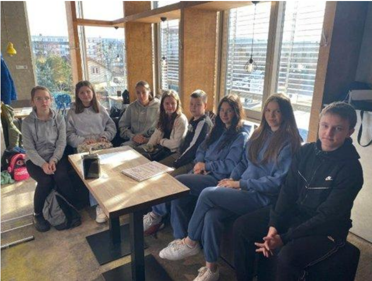
Ferie z GOK (2025)