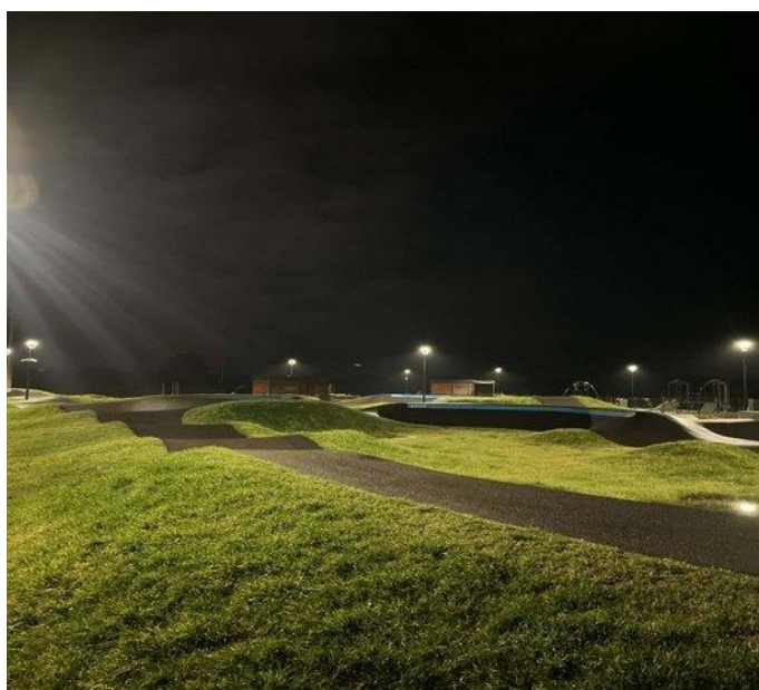
Kompleks Turystyczno-Sportowy w Krasnosielcu (2025)