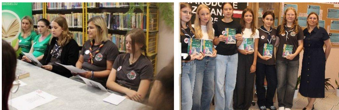
„Narodowe Czytanie” (2025)