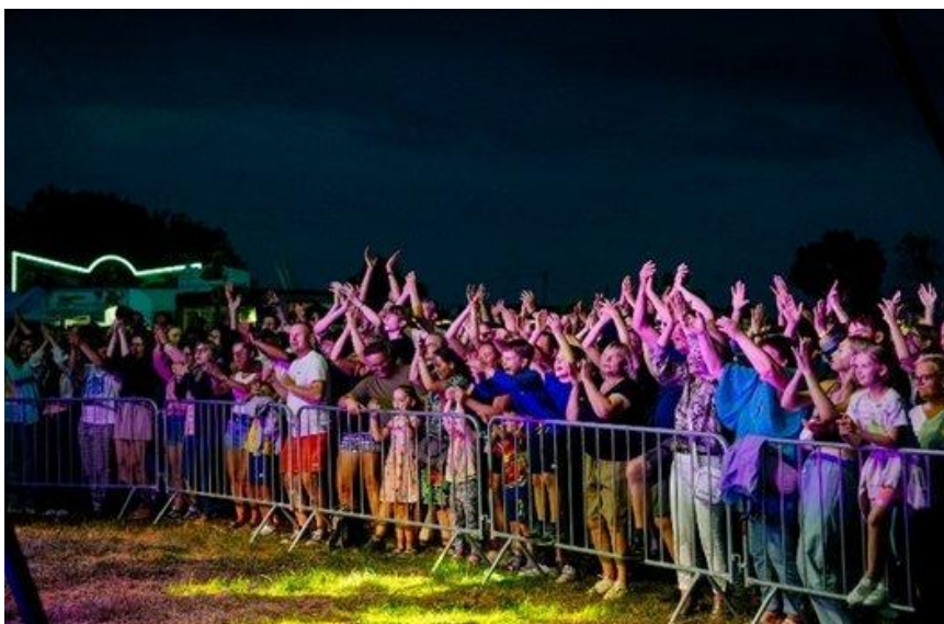
Dni Krasnosielca (2025)