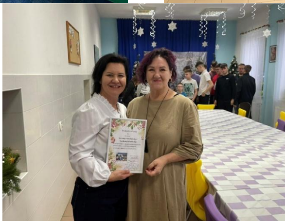
Akcja charytatywna „I Ty możesz zostać Świętym Mikołajem” (2025)