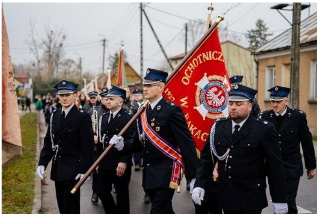
Obchody Święta Niepodległości (2025)