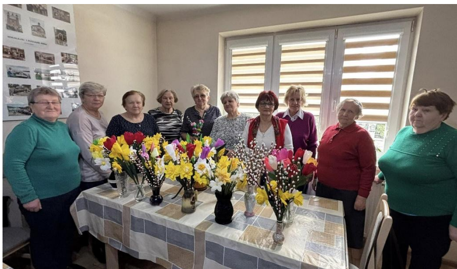
Warsztaty plastyczne (2025)