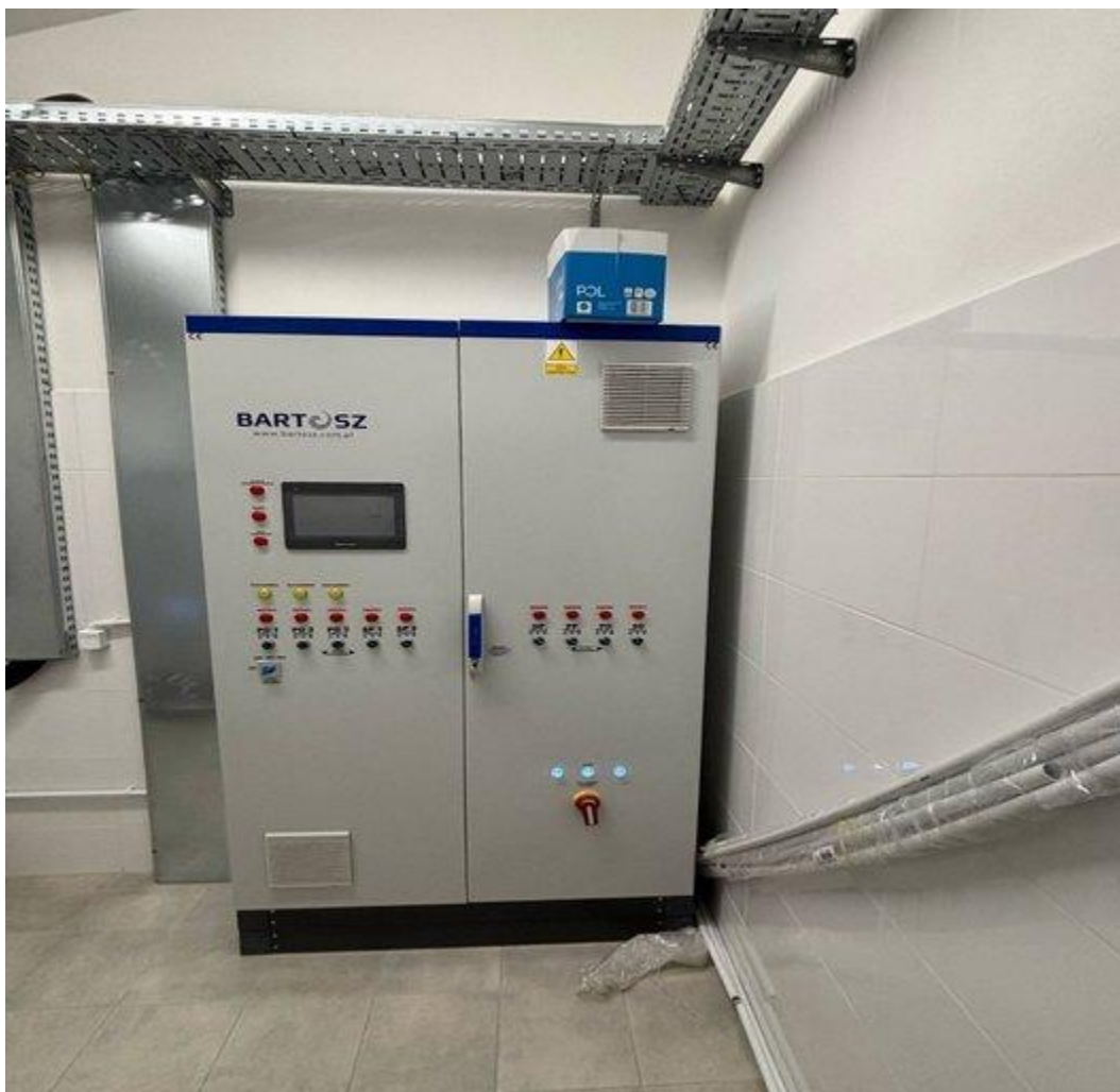
Przebudowa SUW w Drażdżewie Małym (2025)