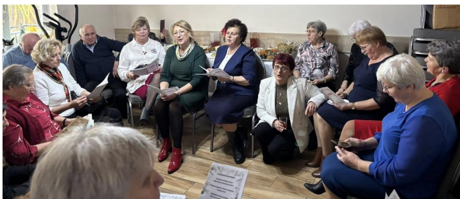
Spotkanie wigilijne (2025)