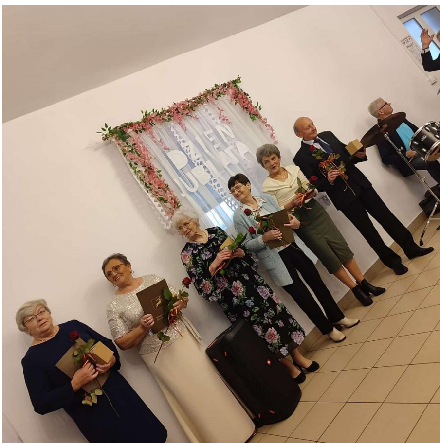
Dzień Jubilatą (2025)