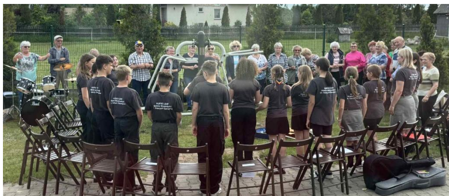
Piknik pokoleniowy z 25 Krasnosielcką Drużyną Harcerską "Waleczni" (2025)