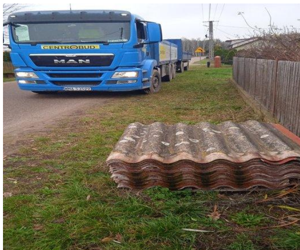
Odbiór azbestu spod posesji (2025)