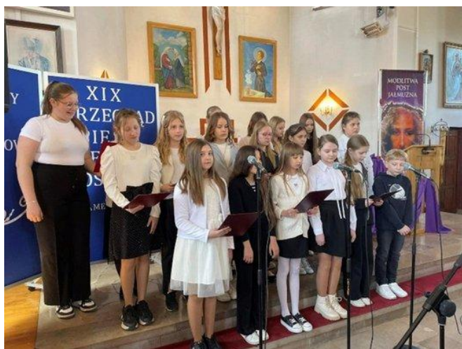
XIX Przegląd Pieśni Wielkopostnych (2025)

23.06 Noc Świętojańska – Teatr Tańca z Ogniem w parku Braci Warner (ok. 100 osób).