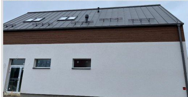
Budowa żłobka w Krasnosielcu (2025)