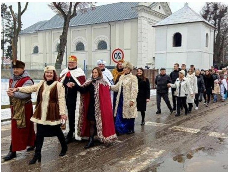
XX Gminno-Parafialny Orszak Trzech Króli (2025)

W marcu zorganizowano wyjazd do Muzeum Żołnierzy Wyklętych w Ostrołęce, przeprowadzono Quiz online o historii Krasnosielca (122 uczestników) oraz zaprezentowano wystawę plenerową OFFE 2024 – 12 plansz z obrazami trójwymiarowymi na rynku.