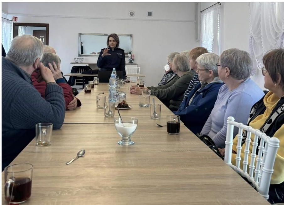
Spotkanie „Bezpieczny senior” (2025)